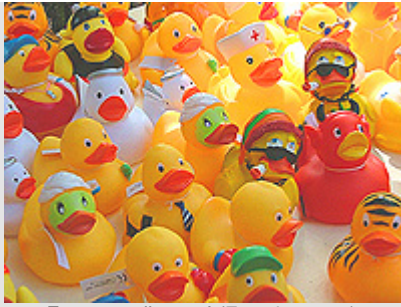
Ente gut, alles gut!