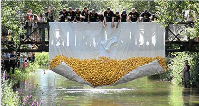
Los geht's: Über 6.000 "Karlsruher Rennenten" lieferten sich ein spannendes...

Nach dem Entenrennen ist vor dem Entenrennen! Der Erfolg der Veranstaltung schreit nach einer Fortsetzung im kommenden Jahr. Die wird es auch geben, versprach "Round Table 46 Karlsruhe"-Pressesprecher Martin Wacker. Das Duckrace soll etabliert werden. Motto: "Das Entenrennen gehört zum 'Fest' wie die Pyramide zum Marktplatz." Die Idee für das Entenrennen in der Günther-Klotz-Anlage kam vom "Round Table 46 Karlsruhe", einer Vereinigung, die sich die Pflege von Freundschaften und soziales Engagement auf ihre Fahnen geschrieben hat.