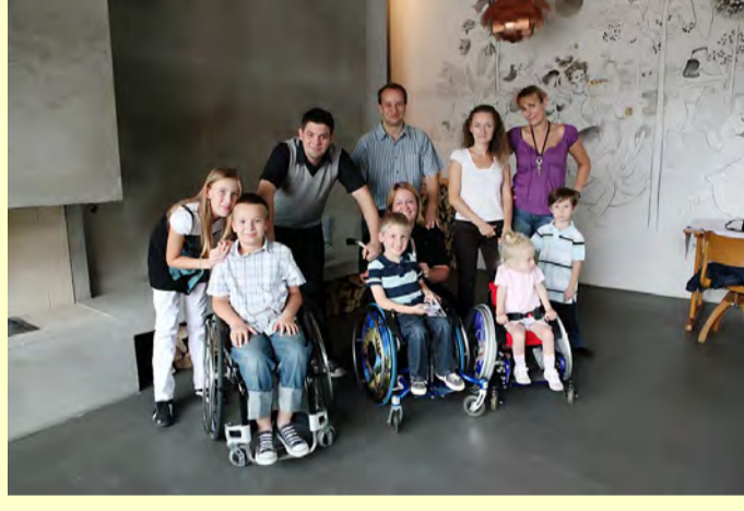
SMA-Kinder und -Geschwister & Tim Mälzer

Eine überaus beeindruckende Veranstaltung war der SMA-Ballett-Abend im Aalto-Theater Essen im Juni. Es kamen über 14.000 € für den guten Zweck zusammen.